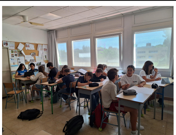
La 5e1 en modo “agencia de publicidad”, creando una campaña de prevención del tabaquismo.