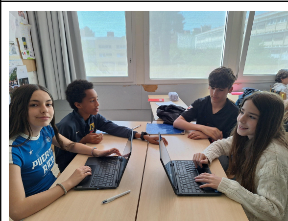
Fotografías de los equipos encargados de la creación y la locución de la cuña radiofónica, y de la edición del audiovisual, respectivamente.