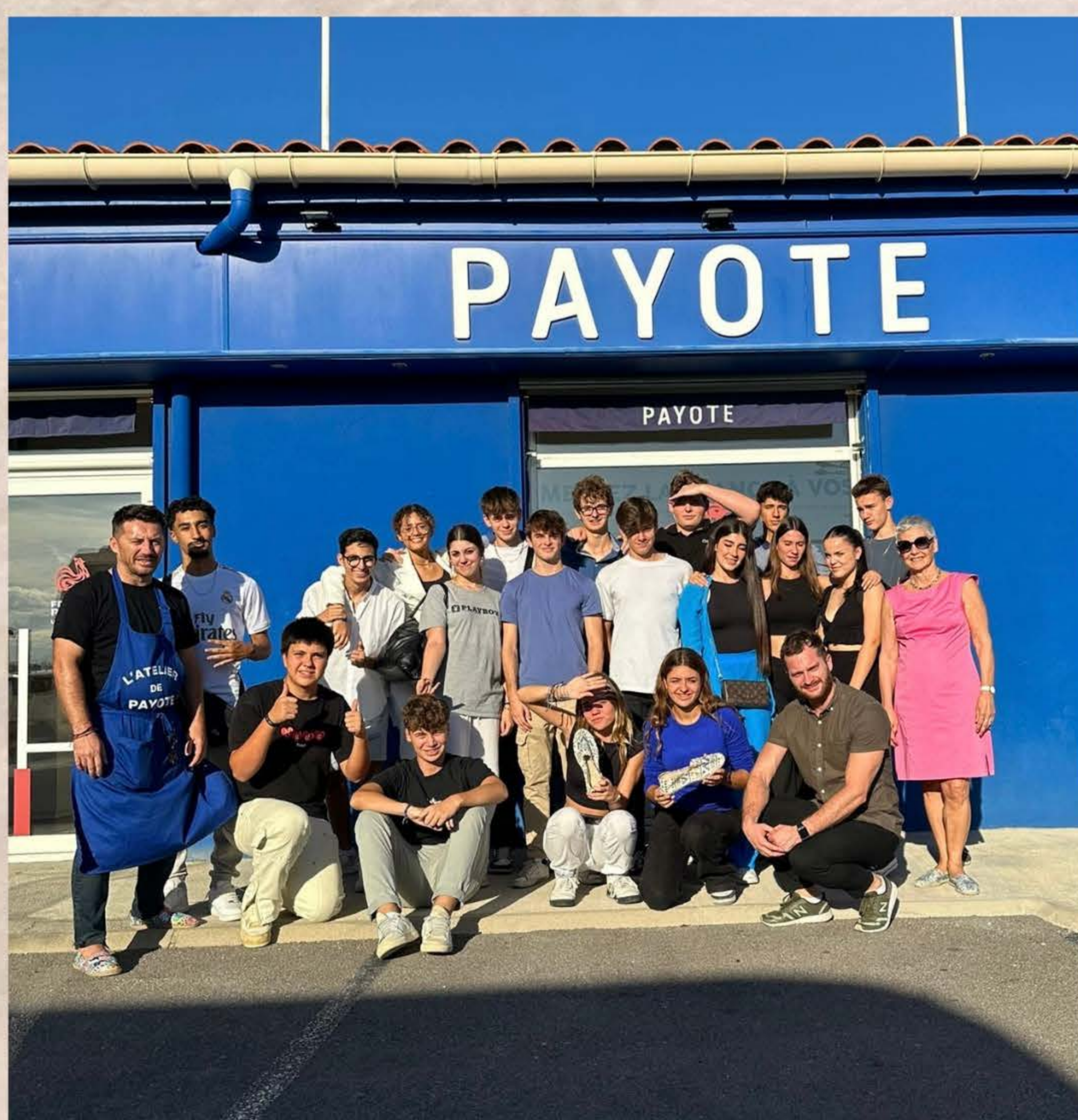
Atelier de Fabrication de Payotte